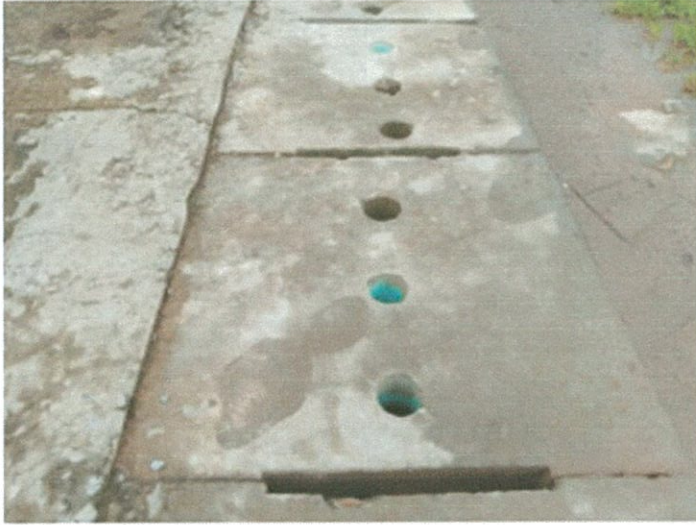
ตลาดมีรางระบายน้ำ พร้อมฝาครอบปิด