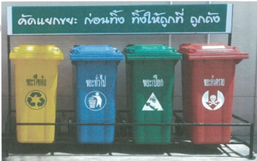
ถังขยะแยกประเภท