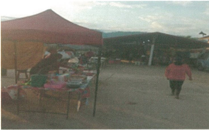
โต๊ะวางสินค้าสูงจากพื้นไม่น้อยกว่า ๖๐ CM