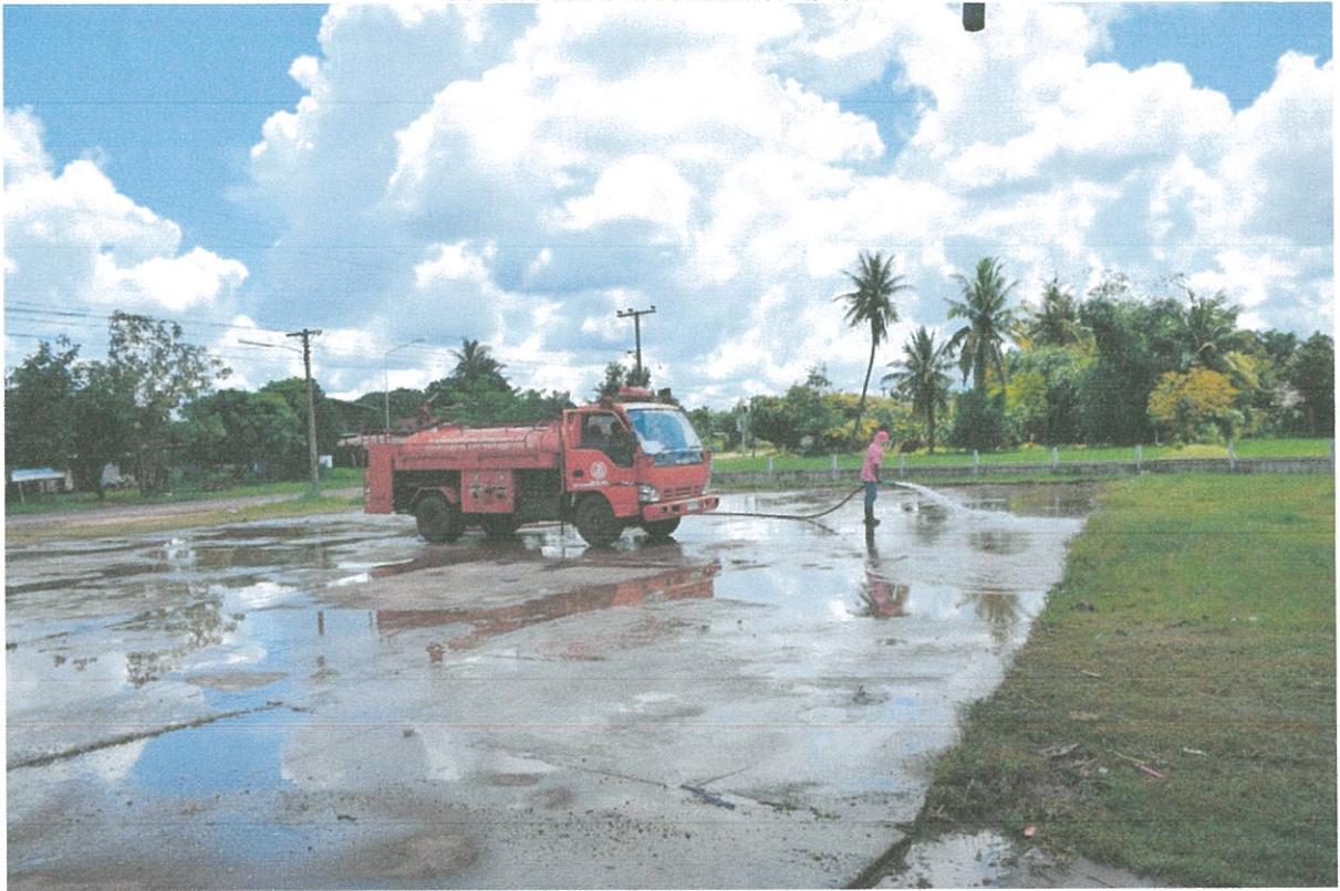
ล้างตลาดอย่างน้อยเดือนละ ๑ ครั้ง