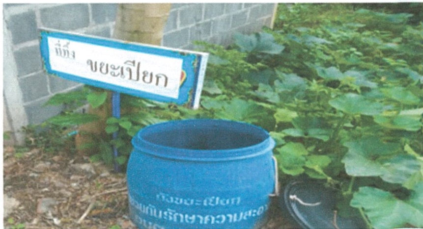
ถังขยะเปียก