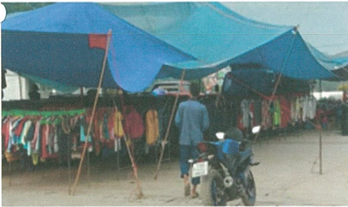
ตลาดและบริเวณโดยรอบไม่มีน้ำขังเฉอะแฉะ